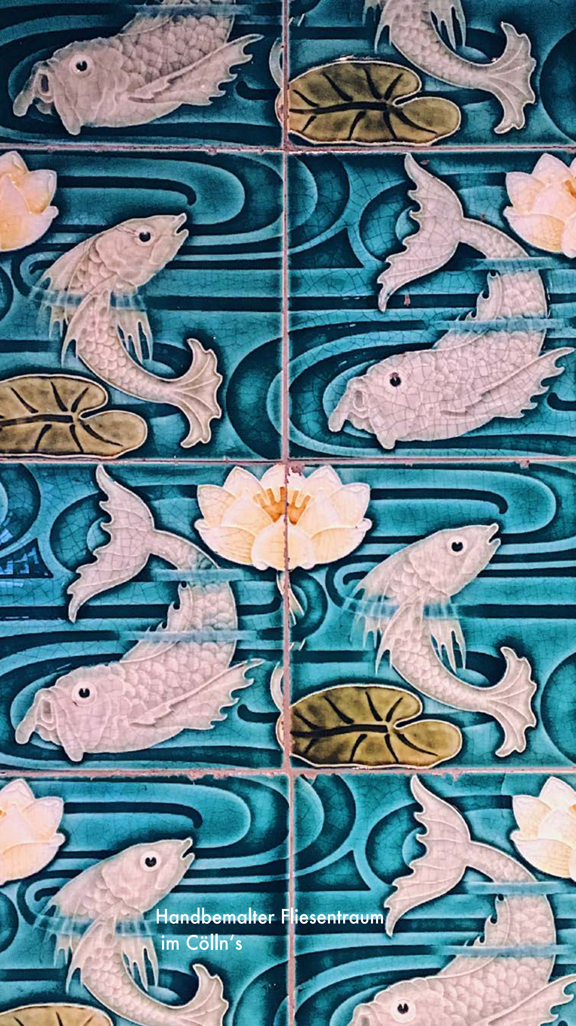
Handbemalter Fliesentraum im Cölln's